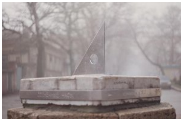
Рис. 2: Фотография 2..

Мраморный циферблат по периметру опоясывает металлический бандаж, на котором читается «Солнечные часы, установлены в 1833 году».