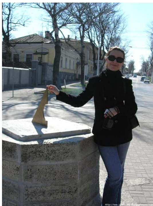
Рис. 4: Фотография 4

Анализируя данные фотографии, можно сделать следующие предварительные выводы.