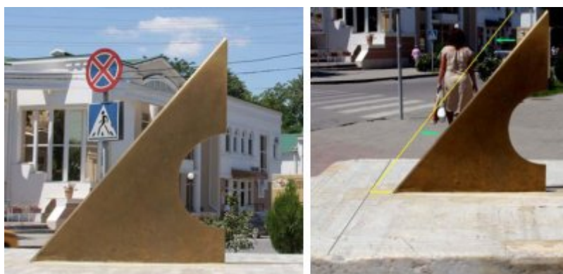
Рис. 6: Фотографии 7-8.

3. Посмотрев на гномон сбоку так, чтобы оптическая ось фотоаппарата был перпендикулярно плоскости гномона, обнаруживаешь, что угол на-