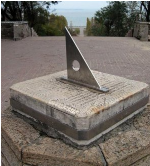
Рис. 1: Фотография 1.

Старые солнечные часы города Таганрога – это памятник истории и архитектуры. Часы построены в 1833 г., во времена правления шестого по счету градоначальника, барона Отто Романовича Франка, верно служившему Таганрогу с 1832 по 1844 год, самый большой по продолжительности срок, который занимали 17 таганрогских градоначальников.