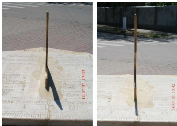
Рис. 5: Фотографии 5 и 6.

о том, что часы отстают на 10 минут. Т.е. в момент последней реставрации ориентация часов была немного нарушена – часы сейчас повернуты по часовой стрелке приблизительно на 2^\circ .