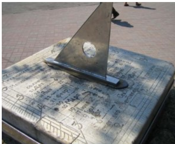
Рис. 3: Фотография 3.

Часы являются горизонтальными. В таких часах гномон наклонен к горизонту под углом равным широте места установки (широта Таганрога 47^{\circ}12' ) и направлен на северный полюс. Однако при реставрации этих часов в 1972 году был установлен гномон, предназначенный явно для большей широты. Это хорошо просматривается на следующей фотографии. Такая замена гномона внесла погрешность в показаниях часов.